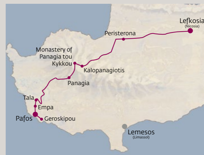
◀ Kykkos Kloster.