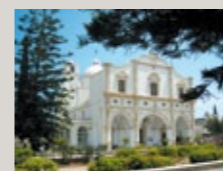
▶ Katholische Kirche von Terra Santa, Larnaka.

In anderen Regionen Zyperns stößt der Besucher auf Sakralbauten, die Menschen anderer Glaubens geschaffen haben. Islamische Moscheen stehen da neben orthodoxen Kirchen und Kirchen anderer christlicher Dogmen und zeugen von friedlicher Nachbarschaft der Menschen. Auch dies beweist die große Geschichte des Volkes und sein Festhalten an Traditionen, die in diesen Monumenten ihren Ausdruck finden.