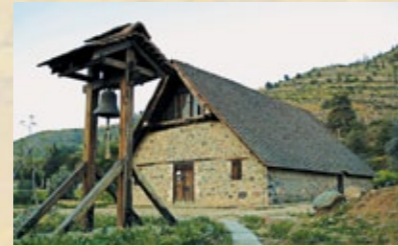
▲ Die Archangelos Michael Kirche in Galata.

Dramatische Küstenabschnitte, azurblaues Meer, imposante Gebirgszüge, grüne Wälder, wildreiche Tierschutzgebiete, ein einzigartiges Ökosystem – und alles badet in Sonne und Licht. Als Zeichen des tiefen Glaubens der Bewohner dieser gesegneten Insel entstanden zahlreiche Kirchen und Andachtsstätten, Zeugen ihrer Frömmigkeit. Sie sind aber auch beeindruckende Zeitzeugen auf einem Ausflug in die Vergangenheit. Zypern kann dem Pilger zu den heiligen Stätten der Christenheit so viel bieten, dass eine einzige Reise nicht ausreicht!