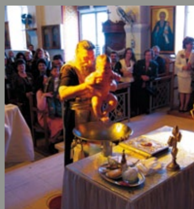
► Taufe in einer orthodoxen Kirche.

I n Zypern bekommt der Besucher die Gelegenheit, an zahlreichen traditionellen Festen, Feiern und Märkten teilzunehmen. Irgendwo auf der Insel, in irgendeinem Dorf oder einer Stadt ist immer was los. Das ganze Jahr hindurch wird gefeiert, erklingen religiöse Gesänge, die ihren Ursprung oft schon im byzantinischen Mittelalter haben. Und in den Tavernen wird auch heute noch die traditionelle Musik gespielt.