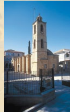
▲ Agios Ioannis Kathedrale, Lefkosia.