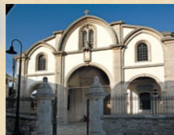
▲ Timiou Stavrou Kirche in Lefkara.