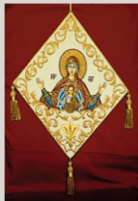
▲ Manipel aus einem Museum.