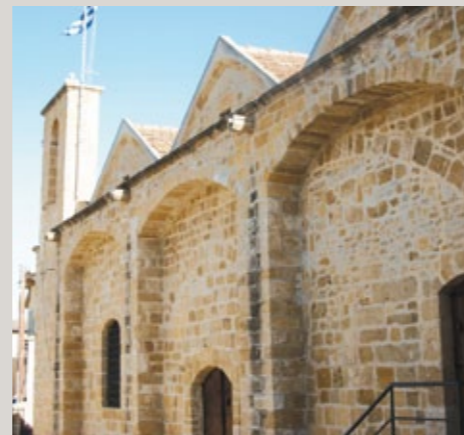
▲ Agios Kassianos Kirche.

Folgen Sie den Spuren der Apostel Paulus und Barnabas, auf Ihrer ersten Missionsreise nach Zypern – Sie leiten Sie durch eine von Geschichte und Kultur geprägte Region.