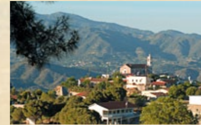
▲ Die Agios Georgios Kirche in Kellaki.