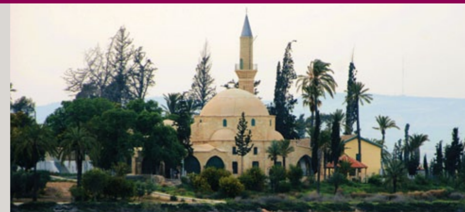
▶ Die Moschee der Um Haram, die Tekke Hala Sultan. Sie steht am Ufer des Salzsees von Larnaka und wird in eine direkte Verbindung mit dem Propheten Mohammed gebracht.