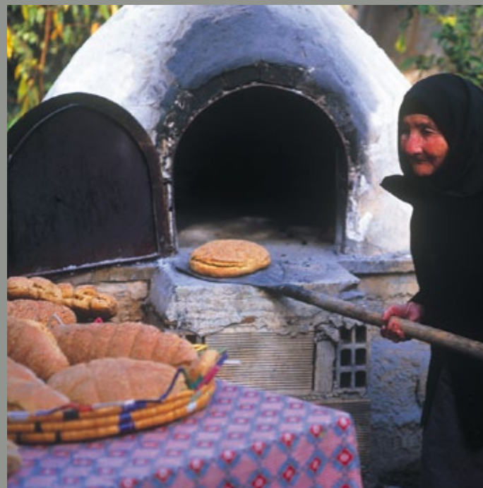
▲ Traditionelles Brotbacken.

dem Schild: Probieren Sie unsere zypriotische Meze! Doch was ihn am meisten beeindruckt, sind die Menschen dieser Insel, ist ihre von Herzen kommende Gastfreundschaft, die den Besucher beglückt und die er nie vergisst.