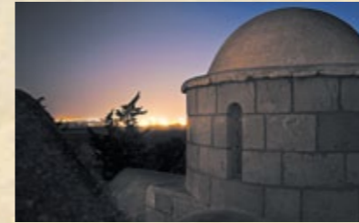
▲ Die Agios Georgios von Hortakion.