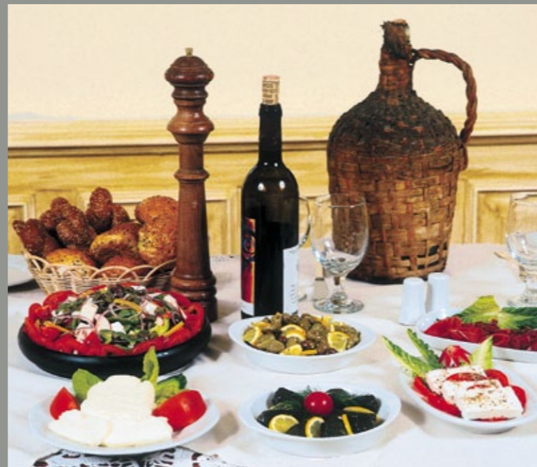
▲ Mediterrane Spezialitäten.

pelte Bedeutung. Aber Zypern wächst und entwickelt sich weiter, und jeden Tag entdeckt der Besucher etwas Neues. Bei einer Reise übers Land findet er unter schattigen Kieferbäumen oder Weinlaubdächern Hunderte von Cafés und Kaffeehäusern, Dutzende von Tavernen, oft mit