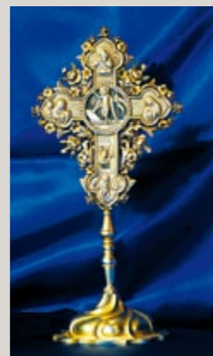
▲ Silberbeschlagenes Kreuz, das ein Stück Holz des Heiligen Kreuzes enthält.

▲ Ein Beispiel feiner byzantinischer Kunst aus dem 6. Jahrhundert n. Chr.: Das bekannte Mosaik aus der Panagia Angeloktisti Kirche in Kiti.