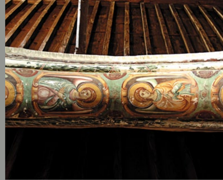
▲ Handgemaltes Gewölbe in Panagia Iamati.

Zypern ist übersät mit bedeutsamen archäologischen Stätten. Die Kultur des Volkes, sein Glauben findet in einer Fülle von Monumenten und Kunstwerken Ausdruck