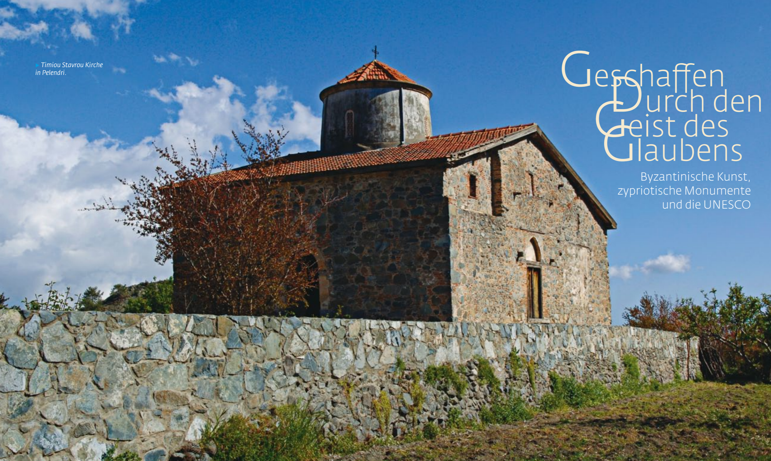
Timiou Stavrou Kirche in Pelendri.