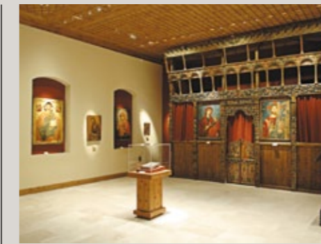
▲ Klostermuseum des Hl. Ioannis Lampadistis.