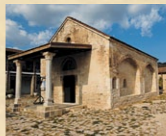
▲ Das Archangelos Michael Kloster in Monagri.