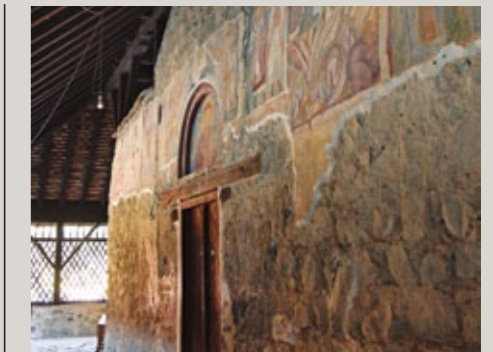
▲ Kloster Panagia tou Araka.