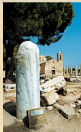
▲ Die Paulus-Säule in Pafos.