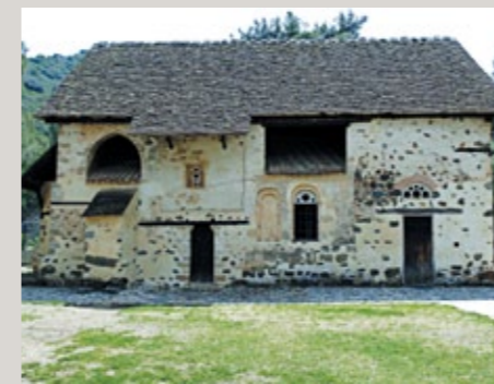
▲ Hl. Nikolaos vom Dach Kirche.