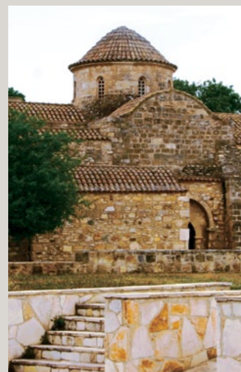
▲ Panagia Angeloktisti, Kiti.