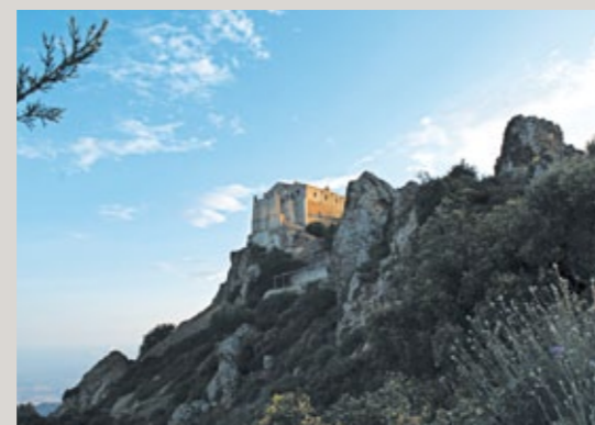
▲ Kloster Stavrovouni

Die Ankunft der Heiligen Helena in Zypern war ein bedeutendes Ereignis, das die fromme Verehrung des Heiligen Kreuzes auf der Insel begründete. Sie brachte das im Heiligen Land aufgefundene Kreuz, an dem Christus starb, auf ihrer Rückreise nach Byzanz mit auf die Insel, gründete das Kloster Stavrovouni und hinterließ dort Splitter des Kreuzes und die Nägel, die Hände und Füße Christi durchbohrten. Diese Relikte sowie Stücke des Kreuzes, an dem zur Rechten Jesu der Schächer starb, und Teile des Seils, mit dem die Hände Christi auf dem Gang zur Schädelstätte Golgatha gefesselt waren, werden dort noch heute tief verehrt.