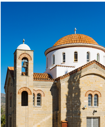
Agia Marina Eptagoneia

In Melini biegen Sie links ab und fahren in Richtung des Gebirgsortes Eptagoneia, ca. 25 Kilometer nordöstlich von Limassol weiter, der insbesondere für seine herrlichen Mandarinen bekannt ist. Hier finden Sie auch die prächtige Kirche der Agia Marina, die sich stolz im Herzen des Dorfes erhebt. Das beeindruckende Gotteshaus wurde im frühen 19. Jahrhundert aus schwarzem Stein errichtet und es heißt, seine Außenmauern seien 1 Meter dick.