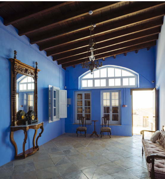
Das Museum von Lefkara

Fahren Sie nun über Skarinou weiter bergauf zu den malerischen Dörfern Kato und Pano (Unter- und Ober-) Lefkara. Der besonders für seine traditionelle Spitzenstickerei – die so genannte Lefkaritika-Spitze – und Silberschmiedekunst bekannte Ort Lefkara (griech. für weiße Berge) wurde nach den weißen Kalksteinhügeln der Region benannt. Dieses malerische Dorf, das sich an die südlichen Ausläufer des Troodos-Gebirges schmiegt, ist mit seinen hübschen, gepflasterten Straßen und den bezaubernden aus Stein gemauerten Wohnhäusern der Kaufleute und Kunsthandwerker sicherlich einen Besuch wert.