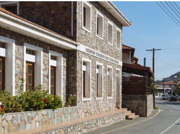
Kalo Chorio Limassol

Bei der Ausfahrt aus Arakapas biegen Sie rechts ab und fahren dann ca. vier Kilometer weiter nach Agios Konstantinos am Südhang des Papoutsas-Berges, wo Fresken aus dem 16. Jahrhundert zu sehen sind, die zu den bedeutendsten heute noch erhaltenen Beispielen des italo-byzantinischen Kunststils auf Zypern zählen. Dieses Gebiet, das besonders für seine fruchtbaren Weinberge bekannt ist, die zur Herstellung von Commandaria genutzt werden, bietet auf 767 Metern Seehöhe einen wunderschönen Panoramablick auf die umliegende Landschaft. Fahren Sie durch das Dorf und biegen Sie am Wegweiser entweder rechts zum kleinen Dorf Agios Pavlos mit seinen herrlich schattigen Nussbäumen und Platanen ab, oder links, um nach Kalo Chorio zu gelangen.