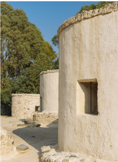
Siedlung von Choirokoitia

Im Herzen des Dorfes, nordöstlich der Kirche, die St. Konstantin und St. Helena geweiht ist, sind noch die Überreste der gotischen Kirche von Timios Stavros (Heiligkreuz) zu sehen.