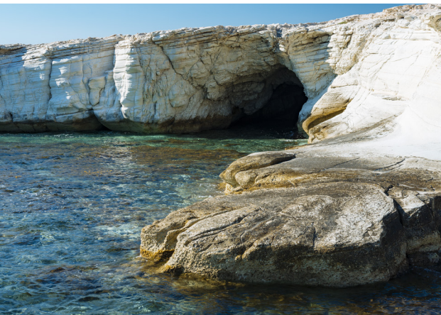
Küste bei Agios Georgios Alamanos

Laufe der Jahrhunderte von den Persern, Ptolemäern, Römern und Byzantinern eingenommen wurde, ehe die Araber sie schließlich im 7. Jahrhundert völlig zerstörten, woraufhin sie verlassen wurde. Zu den wichtigsten Sehenswürdigkeiten zählen die Ruinen eines Aphrodite-Tempels, der Agora, der Bäder, sowie vier Basiliken. Auch eine der weltweit größten monolithischen Vasen, die typisch für den Kult der Göttin Aphrodite ist, wurde hier entdeckt und stellt heute Teil einer Sammlung im Louvre