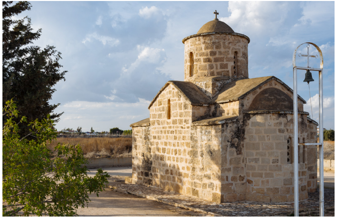
Agia Andronikos Frenaros

Quittant Frenaros en direction d'Avgorou, le paysage reste tout à fait champêtre avec ses champs de blé. A cinq kilomètres approximativement au sud-ouest de Frenaros se trouve sur votre droite l'église de Panagia Asprovouniotissa, célèbre pour ses merveilleuses