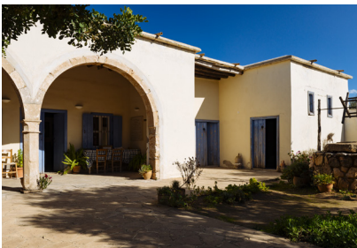
Musée d'artisanat de Deryneia

Les 5 kilomètres qui suivent longent la zone tampon, avec le village abandonné d'Achna en bordure de la zone occupée par la Turquie sur votre droite. Cette route vous conduira à Xylotymvou, un petit village de la région de