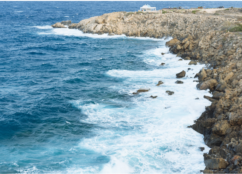
La côte, entre Agia Napa et Protaras

Le circuit débute à Agia Napa, un ancien village de pêcheurs aujourd' hui devenu l'une des stations balnéaires les plus réputées de l'île pour ses immenses plages de sable doré et son animation nocturne.