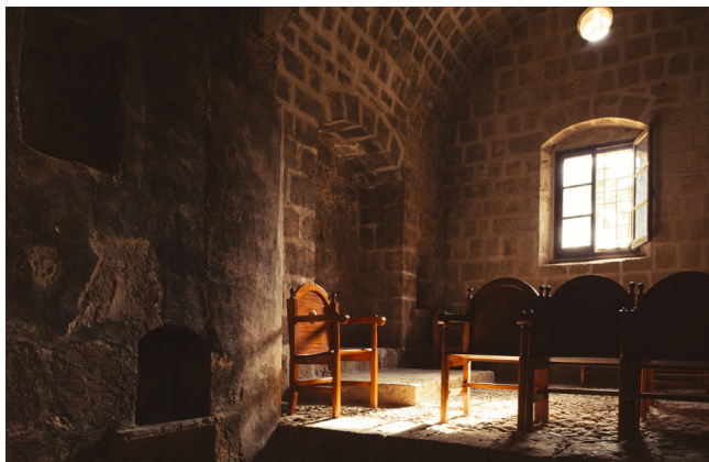
Le monastère d'Agia Napa