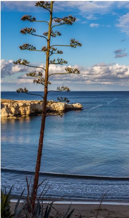
La plage de Kaparis

Protaras et Paralimni, les prochaines étapes du circuit sont situées sur la route principale à quelques kilomètres l'une de l'autre. Paralimni, dont le nom signifie « le long du lac », est la plus grande municipalité de la région libre de Famagouste. Sa magnifique place centrale est dominée par l'imposante église en pierre d'Agios Georgios. L'été, on peut y déguster de délicieuses friandises telles que le soutzoukkos, (un long ruban composé d'amandes trempées dans un épais jus de raisin que l'on fait sécher en les suspendant), des amandes sucrées et bien d'autres choses encore. A noter que, hors saison, on trouvera plus facilement des restaurants et hôtels ouverts ici qu'à Protaras ou Agia Napa.