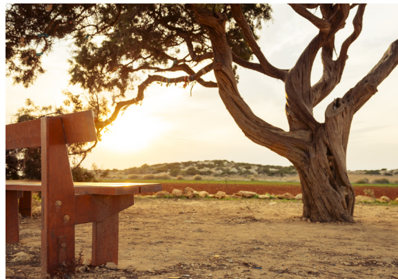
Le cyprès-génévrier de Cap Gkreko

Il est recommandé de s'arrêter au Cap Gkreko, aussi appelé Cavo Gkreko, un superbe promontoire rocheux dominant la mer au sud-est de l'île, aujourd'hui préservé par