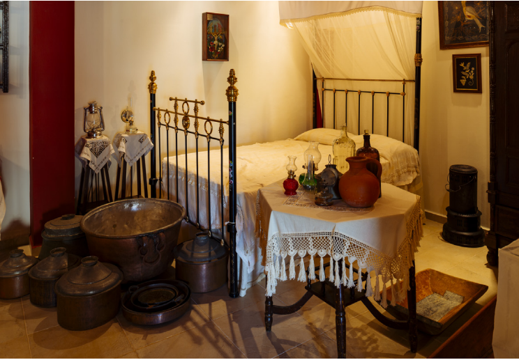
Musée du Monastère d'Agios Rafael à Xylotymvou

le Metropolitan Museum of Art à New-York.