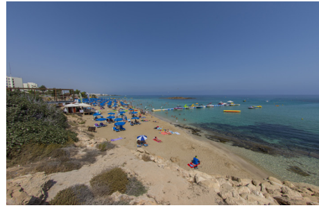
La baie de Fig Tree à Protaras

Suivez la route jusqu'au bout pour rejoindre l'avenue principale, puis avant de quitter Protaras pour aller à Paralimni, faites un détour afin de visiter l'église du Profitis Ilias (Prophète Elie), juchée au sommet d'une colline et qui offre une superbe vue sur la ville côtière et la mer, récompense qui vaut bien les 100 marches et plus qui y mènent.