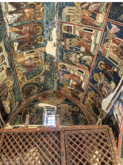
Тимотиос Ставрос. Пелендри

Поезжайте на север от кольцевой развязки Полемидия в сторону Троодоса на В8 и так вы выедете в Агезию и на Корфи. Этот посёлок был построен в 1970-х годах для размещения жителей деревни после оползней, причинивших большой урон, т.к. первоначальное поселение небезопасным.