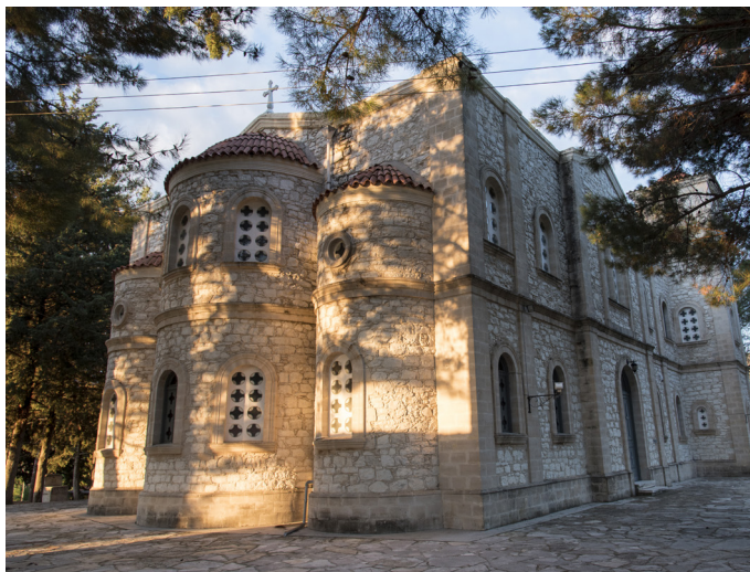
Церковь Агиос Иоаннис Теологос. Пера Педи.

В этих винных деревнях, которые удачно расположились на западном берегу реки Криос, вы найдете традиционные мастерские, которые производят кипрские сладости и вина, и где вы сможете понаблюдать, как делаются такие деликатесы, как сутзукос, киофтери, палузас, дактила и многие другие сладости.