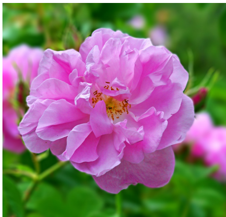
Дикая Роза. Агрос.

Агрос широко известен как деревня роз. Если вы будете на Кипре в мае, то вам представится прекрасная возможность побывать на знаменитом ежегодном Фестивале Роз.