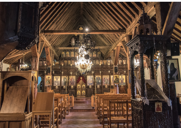
Церковь Агия Марина. Киперунда

Деревня Киперунда, возможно, получила свое название от «киперос» (научное название, Cyperusrotundus ) - сорняк, который широко произрастает в этом районе и используется для кормления животных. Посетите небольшую часовню Святого Креста с фресками, которые датируются 1521 годом. Интересной особенностью церкви является ее неровная деревянная крыша, которая имеет форму заглавной английской эль. Сейчас часовня фактически превратилась в музей.