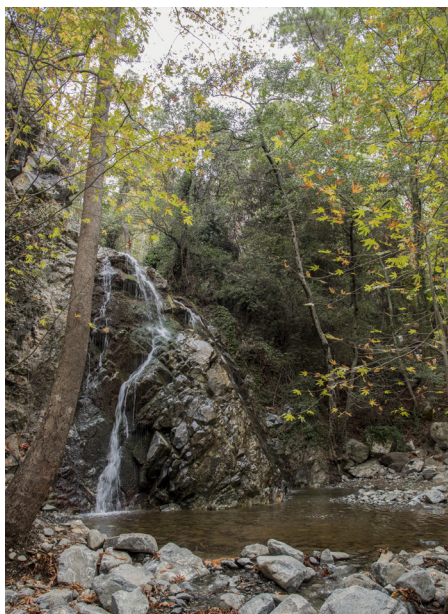
Хантара. Водопад Фини.

Когда вы покинете Троодос, следуя по дороге в Продромос, вы можете поехать налево, чтобы посетить самый высокий пик горного хребта - гору Олимпос. Продромос - популярная деревня, удивительно прохладная летом, с прекрасным местом для пикников, расположенного недалеко от плотины и